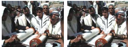
שו"ת עם הרב דוד אברהם ספקטור